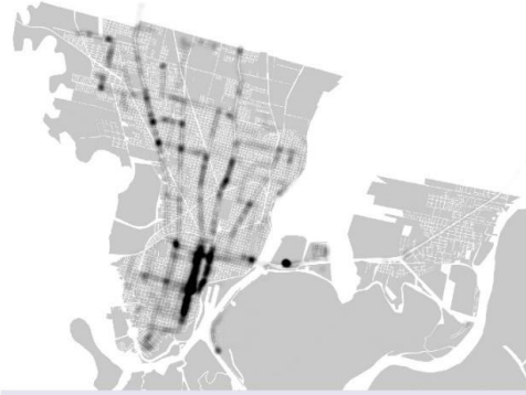
SUBE - OPERACIONES