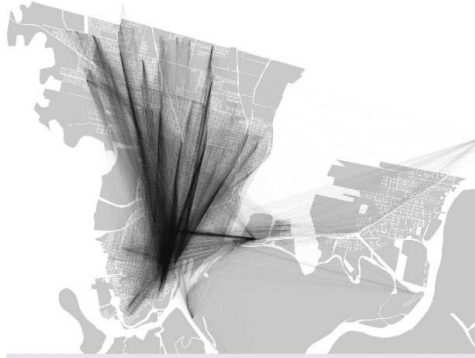
SUBE - VIAJES